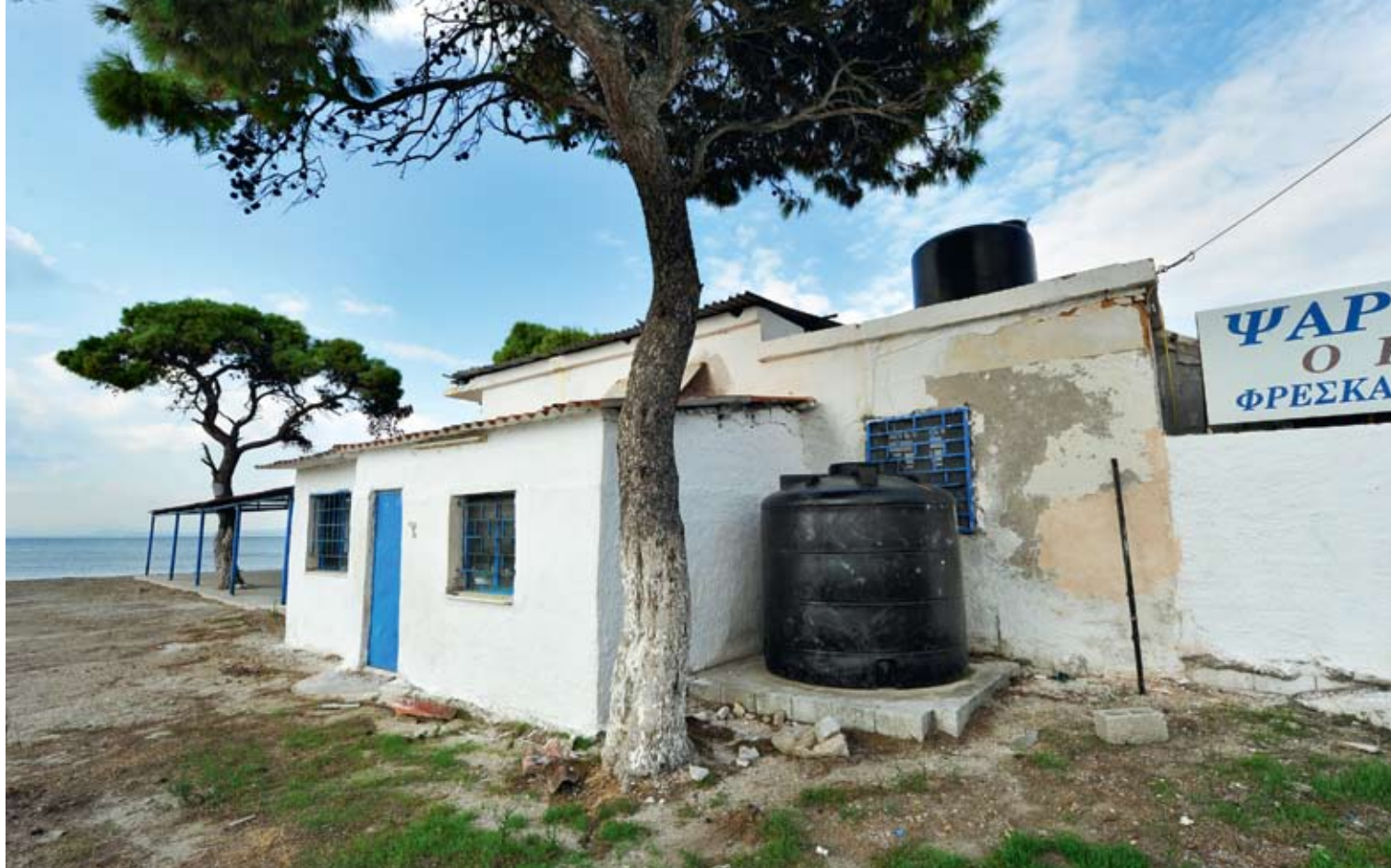
ΠΑΡΑ ΤΗΝ ΑΦΑΙΡΕΣΗ των αδειών λειτουργίας και τη σφράγιση των καταστημάτων, οι ταβέρνες δουλεύουν κανονικά.