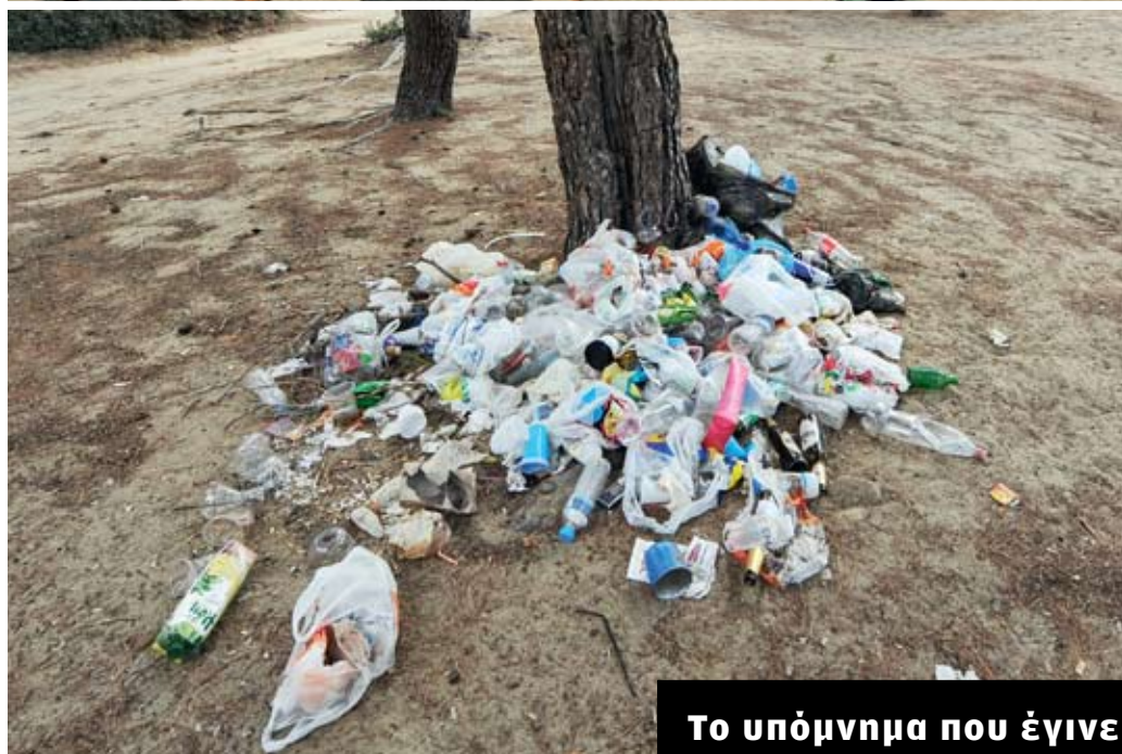
ΑΛΛΟΥ ΤΥΠΟΥ αξιοποίηση αξίζει ο πανέμορφος Σχινιάς.

Υποτίθεται πως από το 2000, οπότε ιδρύθηκε το Εθνικό Πάρκο, θα έπρεπε να έχει μπει μια τάξη στο ευαίσθητο αυτό οικοσύστημα.