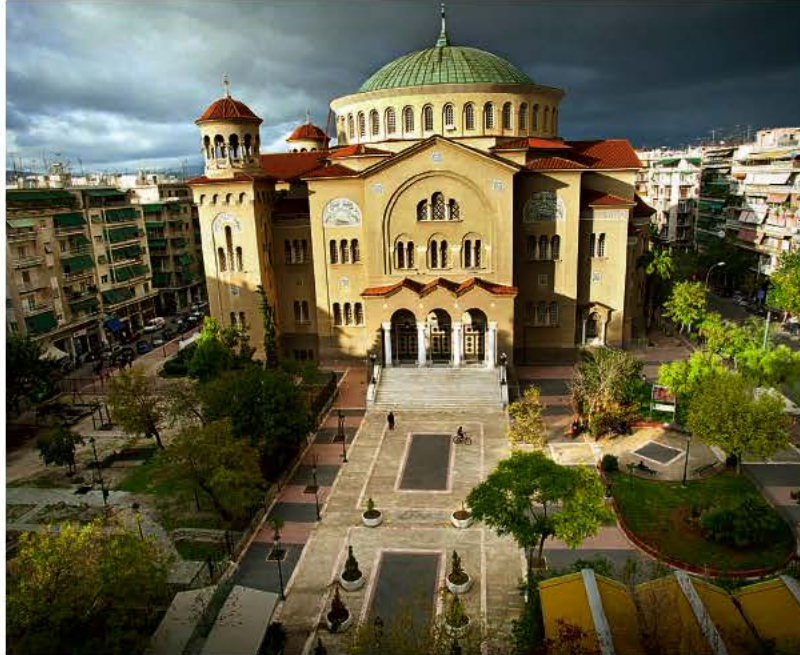
Μπροστά από την εκκλησία η επίμαχη παιδική χαρά, κλειστή από το 2009.