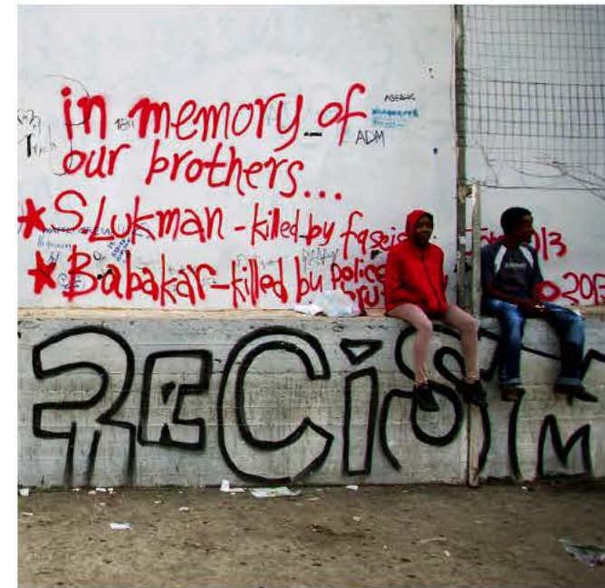
Εικόνες της σύγχρονης καθημερινότητας.

δαπούς. Δεν έχουμε τίποτα εναντίον των νόμιμων μεταναστών, όσων έρχονται για να εργαστούν και να ζήσουν τις οικογένειές τους, απαιτούμε όμως να εφαρμόζονται οι νόμοι. Γιατί δεν έλεγαν τίποτα οι "αντιρατσιστές" όταν βλέπαμε κάποιους να βγαίνουν από την παιδική χαρά κρατώντας παιδιά και να τα δίνουν σε πολυτελή τζιπ που σταματούσαν; Όταν συλλαμβάνουν κάποιον αλλοδαπό, αμέσως εμφανίζονται τρεις - τέσσερις δικηγόροι να τον υπερασπιστούν. Το 75% των μαγαζιών ανήκει σε αλλοδαπούς. Όταν ένα μίνι μάρκετ πουλάει από κοτόπουλα μέχρι βαφές μαλλιών προς 1 ευρώ, τίθεται ζήτημα αθέμιτου ανταγωνισμού, αφήστε που λειτουργούν 24 ώρες το 24ωρο και δεν ελέγχονται από πουθενά».